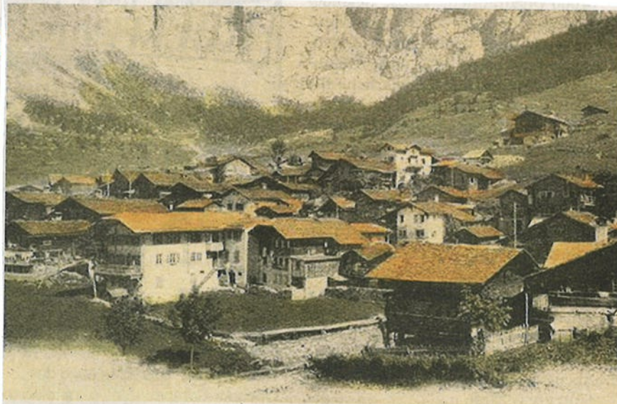
Das älschtuscht Schüölhüüs im Badu (1850–1938, linggs im Bild)