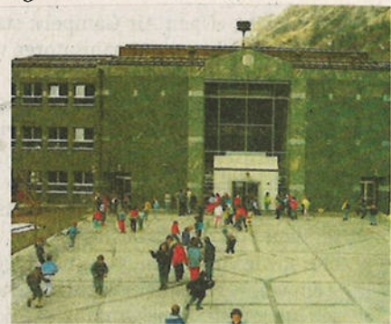
Ds hitig niib Schüälhüüs im Badu