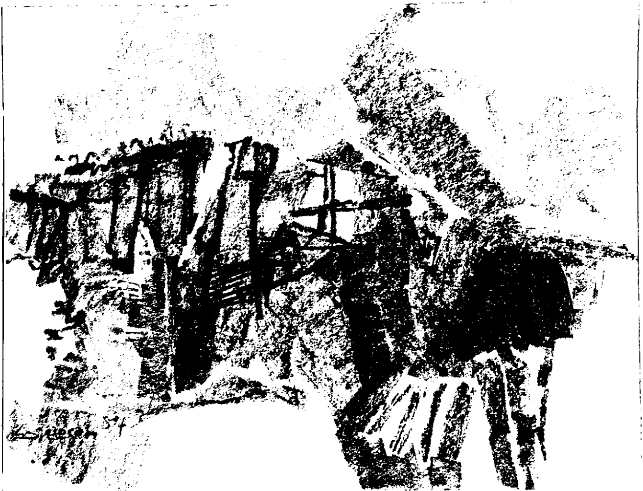
Meine Sehnsucht, ein altes Haus im Walliser Berg, Pastell.