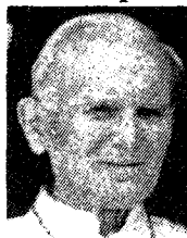
Papst Johannes Paul II.

Der Papst hat sich in seinem Interview mit der italienischen Zeitung «La Stampa» auch zum künftigen Aufbau Europas geäußert.