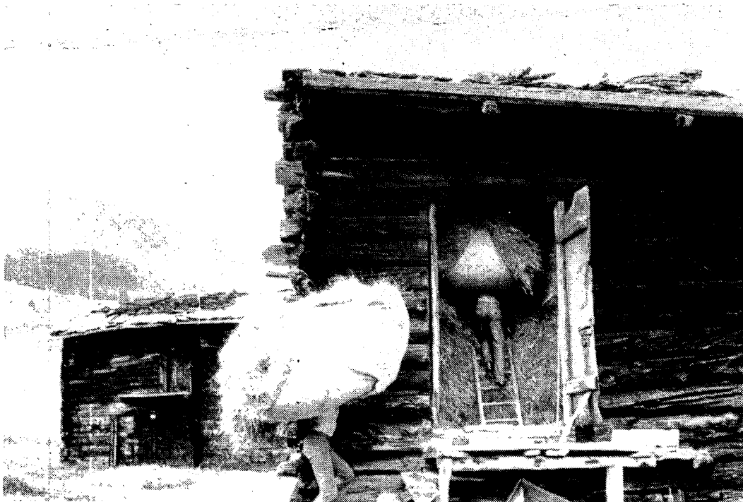
Heuschöber im Landwassertal (Graubünden): Wie im Wallis!