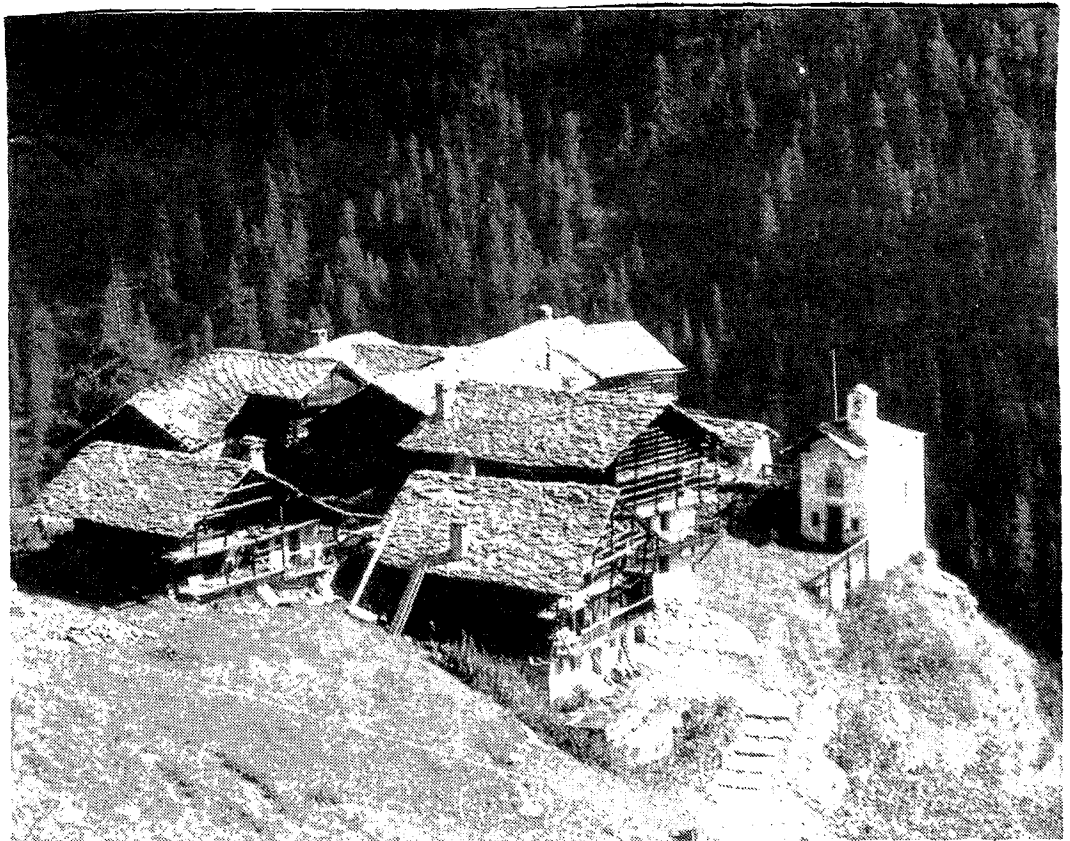
Walersiedlung Albenzu in Gressoney-St-Jean.