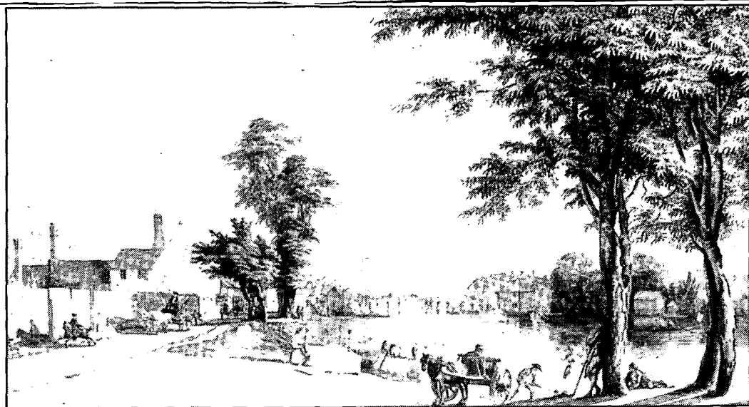
Paul Sandby: Der Hafen von Windsor, 29,3x58,1 cm, Bleistift, Tinte, Aquarell und Gouache, 1775.

Aquarellfarben enthalten feinstgemahlene, durch ein wasserlösliches Bindemittel (Gummi arabicum, Dextrin usw.) zusammengehaltene Pigmentteilchen. Diese sogenannte «Wasserfarbe» wurde bereits zur Illustration mittelalterlicher Handschriften verwendet. Albrecht Dürer und auch Hans Holbein der Jüngere wandten die Aquarelltechnik schon sehr frei an. Das Aquarell wurde dann etwas durch die Ölmalerei verdrängt. Man benutzte es oft zur Gestaltung von Vorskizzen zu Ölbildern oder von Bildern in Mischtechnik. Es galt lange Zeit als «mindere Technik». Dies änderte sich im ausgehenden 18. Jahrhundert in England, wo um 1768 unter den Gründern der Royal Academy of Arts (= Kö-