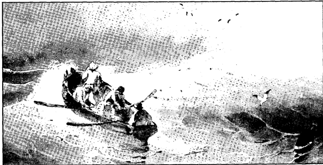
Richard P. Bonington: «Kleines Boot auf bewegtem Meer», 13,8x19 cm, Bleistift und Aquarell, 1818 Ausschnitt.

über die Ausstellung können über die Internet-Adresse www.fondation-hermitage.ch abgefragt werden. Der Besuch der seit 1955 ersten wichtigen schweizerischen Ausstellung über das englische Aquarell ist sehr lohnend. Da die ausgestellten Werke durch Licht leicht Schaden nehmen, kann die Ausstellungsdauer nicht verlängert werden. Das in der Lausanner Hermitage in drei Stockwerken gezeigte Ausstellungsgut bildet eine wertvolle Ergänzung zu der am 5. März 1999 in Martinach beginnenden Ausstellung «Turner und die Alpen». ag.