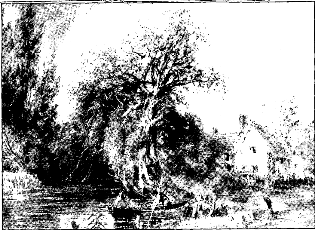
John Constable: Bauernhof an einem Fluss, 14,5x19,6 cm, Tinte und Aquarell, 1832.

Zu einzelnen Aspekten dieser schönen Ausstellung veranstaltet die Museumsleitung am 17. Februar, 10. und 31. März, 21. April und 12. Mai jeweils von 12.30 bis 13.00 Uhr Referate. Darüber hinaus finden donnerstags um 18.30 Uhr und sonntags 15 Uhr öffentliche Führungen statt. Zwei Broschüren für Kinder von sechs bis acht und von acht bis zwölf Jahren führen auf spielerische und lehrreiche Art in die Ausstellung ein. Ein botanischer Pfad in der Parkumgebung des Museums lässt die Kinder auch sehr schöne Bäume entdecken. Und: Viele Angaben