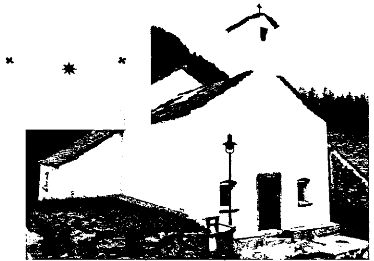
D Eggukapälla. D Schtäärna i där Eggukapälla (chleis Bild obena)

Bis Endi vam 14. Jaarhunnärt ischt ds Gibiät vam Obru Drittul (zwischen Engiloch und Egga) unnär där Herrschaft van dä Edlu va Urnawäss ggsi. Anno 1399 heint viär Iheimischschu va hiëna und va daana dum Bäärg denä Edlu alli Rächti vam Obru Drittul abgchoift. Mit dem Friichoif ischt oi ds Friiggäricht Waaldärubäärg, un eiguni Gmei, untschtannu, wa appa halb so vill Liit gchäbä het, wa ds Doorf Simpilu wiitär unnuna. – Und usoo het deer glickhaftig Schtääru afa zintu! Das het fascht zweihunnärd Jaari gituirät, bis am 31. Oigschtu 1597. Van där Homattu ícha hed um mächtigä Gletschärabschturz ds ganz Deerffji zwischschunt dum Trii-